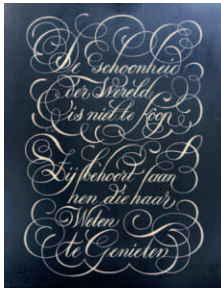
Wim van den Berg zette de letters van het tableau “De schoonheid der wereld is niet te koop ...”.

“De plafondschilderingen in de Sint Servaas in Maastricht, waar we zeer zorgvuldig met een scalpel de oude verflagen verwijderden en dan prachtige schilderingen tegenkwamen. Dan kunnen we met heel specifieke technieken nu impregneren en bijwerken. Via een kennis kwam ik in aanraking met Parijs, waar ik door de architect werd gevraagd aan enkele paleizen te werken met de specifieke caseïnetechniek. Caseïne is een overschot uit de kaasbereiding. Dat witgelige poeder moet je eerst lauwwarm ‘ontsluiten’