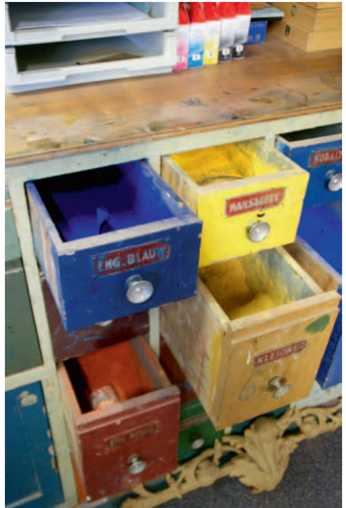
Deze pigmenten vormen slechts de basis: met mengen krijg je de mooiste resultaten.

Die gebruiken we voor het schilderen van de hout- en marmerimitatie. Dan kan je glaceren, er diepte in leggen. Die (ronde) chiqueteurs met eekhoornhaar gebruiken we voor groen marmer; door met verschillende tinten op die kwast rond te draaien over je werk krijg je daarbij de gewenste effecten. En voor letters, bijvoorbeeld bij het schilderen van registerplaatjes, gebruiken we de penselen met marterhaar, die zijn wat veerkrachtig en daarmee kun je heel precies de letters zetten." Ook zie ik nog de grotere tamponneerborstels hangen voor het patineren en tamponneren. Een indrukwekkende verzameling van het gereedschap waarmee de vakman aan de slag gaat.