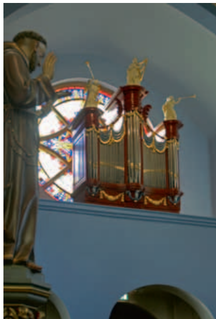
Esch, Sint-Willibrorduskerk (Heinemann 1788 / Van Hirtum 1817).

lades ziet met het pigment in diverse kleuren: de grondstoffen voor de specifieke verven die hij moet aanmaken voor zijn specialistische vakwerk. Bescheiden zeg ik dat ik soms thuis de kwast hanteer voor de Flexa-verf, en dat Annie het penseel gebruikt met de Rembrandt- en de Van Goghverf, maar dit hier is wel echt heel bijzonder. “O, dan moet je de oude kast van mijn opa zien, die hebben we hier achter nog staan. En de diverse lades zijn nog gevuld. Die lade moet je maar niet aankomen, want in dat pigment zit ook arsenicum ...”. Dit pigment is de basis om de gewenste kleur verf aan te maken. “Dat gebeurt door het te mengen met lijnolie en terpentijn, terwijl je krijt toevoegt als vulmiddel. Uiteraard moet je dan nog kobalt-siccatief toevoegen als droogmiddel.”