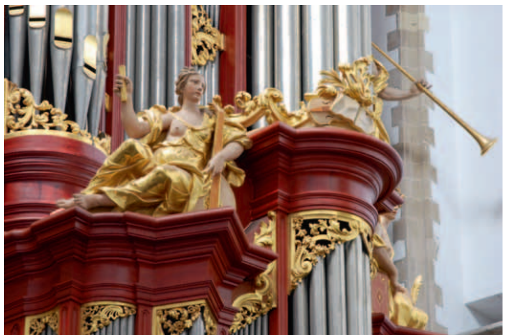
Detail van het Müller-orgel in de Grote of Sint-Bavokerk in Haarlem.