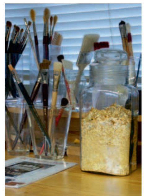
Restjes bladgoud, zuinig bewaard ...