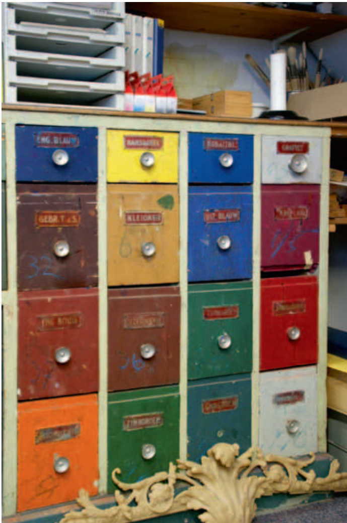
Ladenkast met pigment in de basiskleuren.