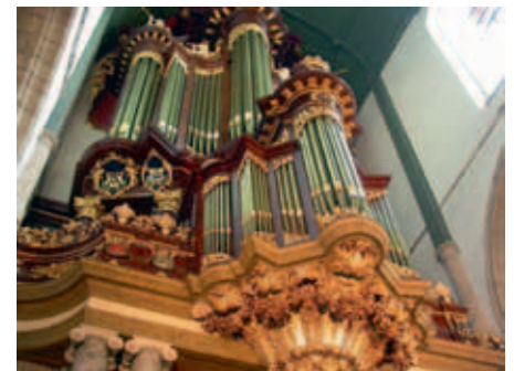
Een visitekaartje: het orgel in de Sint-Janskerk te Gouda.