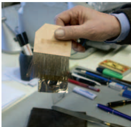
Bladgoud wordt uit het boekje gelicht met het goudmes, gesneden en met een “petit gris” opgepakt om aangebracht te worden op het werkstuk.