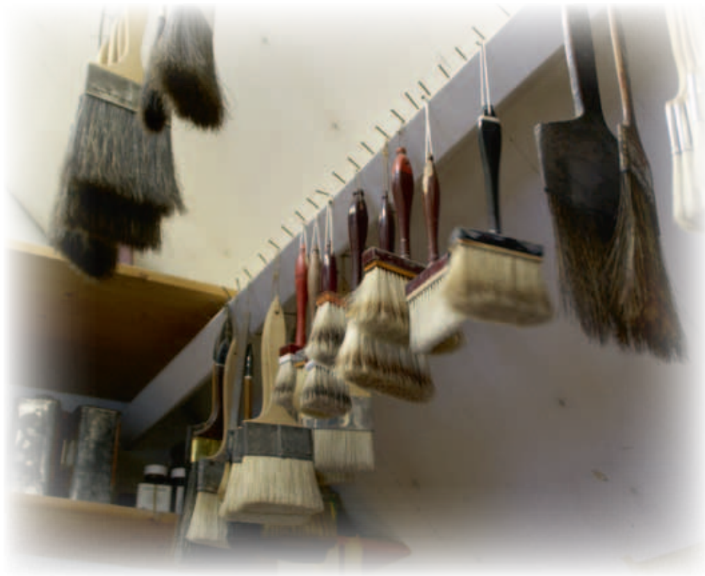
Een indrukwekkende collectie penselen en kwasten.