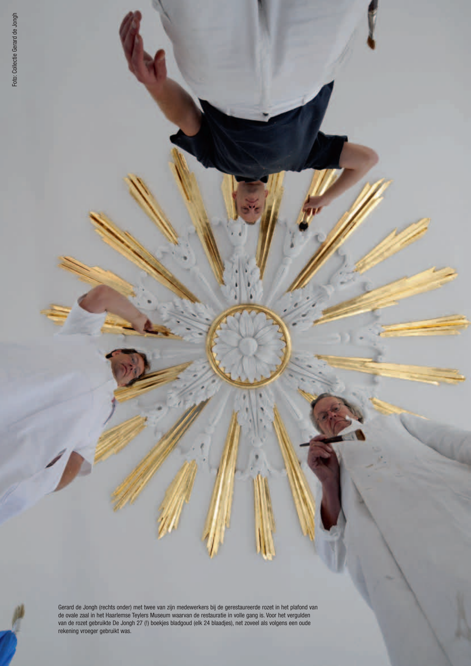
Gerard de Jongh (rechts onder) met twee van zijn medewerkers bij de geresatureerde rozet in het plafond van de ovale zaal in het Haarlemse Teylers Museum waarvan de restauratie in volle gang is. Voor het vergulden van de rozet gebruikte De Jongh 27 (!) boekjes bladgoud (elk 24 blaadjes), net zoveel als volgens een oude rekening vroeger gebruikt was.