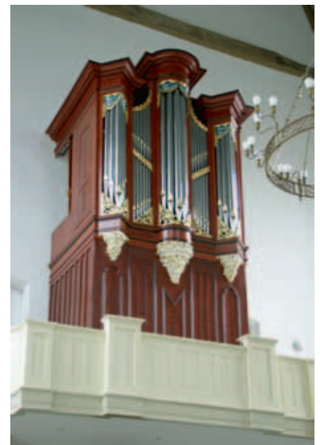
Middelburg, Christelijke Gereformeerde Gasthuiskerk, midden 18 e eeuw.

Van welk materiaal zijn die pense-len? , vraag ik, duidend op een breed, ‘luchtig’ penseel. “Dat is een penseel van dassenhaar, om te verdassen.” De vraagtekens in mijn ogen zorgen voor een verdere toelichting van zijn kant. “Wanneer je bezig bent met bijvoorbeeld een houtimitatie, en je hebt je patronen in je werk gelegd, dan moet je hiermee heel luchtig als het ware uitwaaiëren over dat patroon, en dan krijg je die prachtige effecten; verdassen is eigenlijk verzachten. Overigens is dit penseel nog van mijn opa geweest, is misschien wel honderd jaar oud.” Wetend hoe ik met kwasten omga nadat ik geschilderd heb, stel ik de in mijn ogen logische vraag hoe je dat penseel dan weer schoon krijgt. “Gewoon, met groene zeep. En deze spalters, al dan niet vertand, zijn van Chinees varkenshaar.