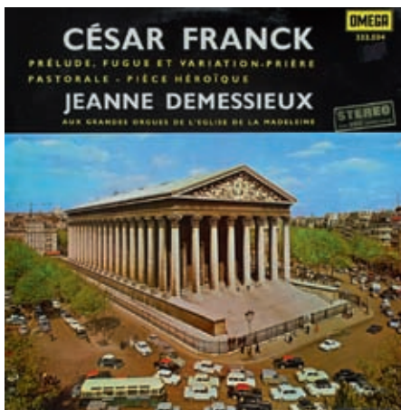
Een oorspronkelijke Omega-hoes van de lp-serie met complete orgelwerken van César Franck die in 1961 werd onderscheiden met de Grand Prix national du disque.