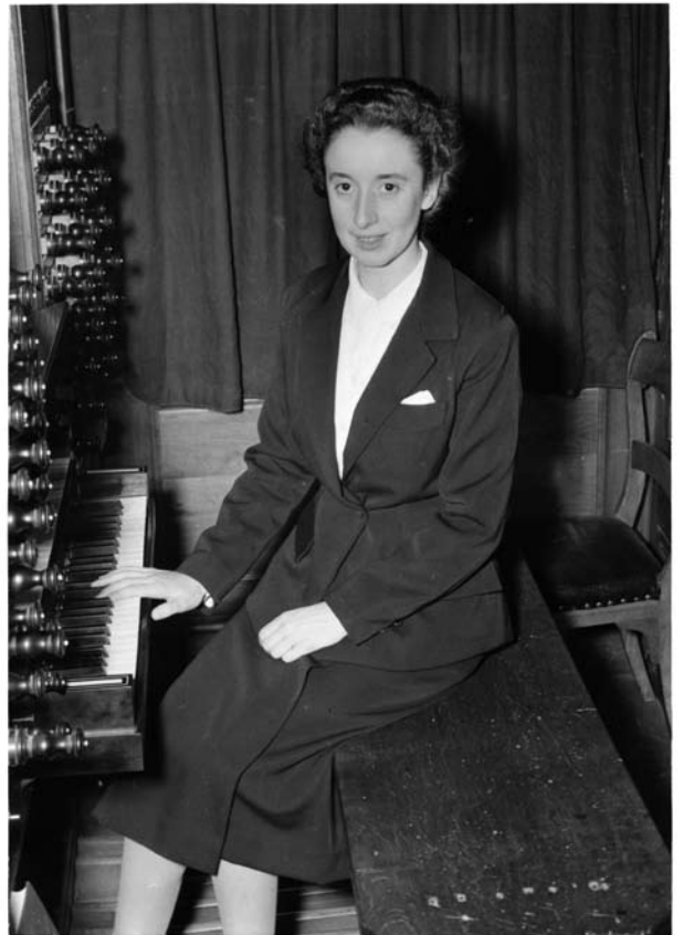
Aan het orgel van de Pieterskerk in Leiden, 26 september 1949.

Nadat een docentschap in Parijs aan haar voorbijging werd ze docente in Nancy in 1952 en vervolgens in Luik, de geboorteplaats van César Franck. Hier werd als proeve van bekwaamheid een verhandeling van haar geëist