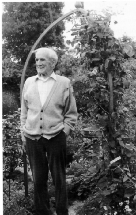
In zijn bloementuin in Acklam.