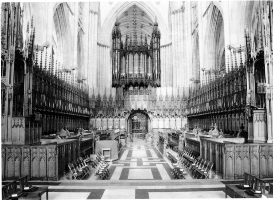
Het koorgestoelte en het orgel van York Minster.