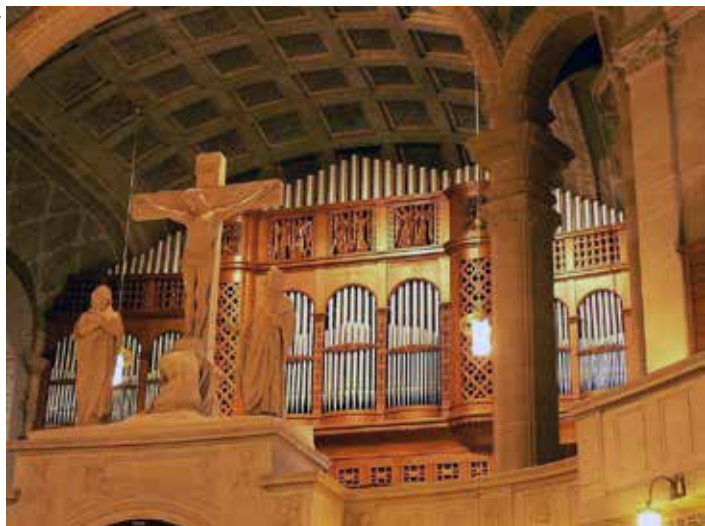
Mannheim, Ev. Christuskirche, 1911 (Opus 1100, IV/P/92).