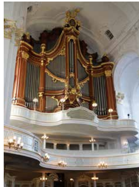
Hamburg, Michaeliskirche, 1960/'61 (Opus 2000).

In het kader van de internationaal steeds meer historisch georiënteerde orgelbouw en restauratiepraktijk specialiseert de firma Steinmeyer zich in de jaren '60 meer en meer in de restauratie van historische instrumenten. Een mijlpaal in die ontwikkeling vormt het in 1962 opgeleverde vijfmanuaals orgel voor de Michaeliskirche in Hamburg. Het vervangt het in de Tweede Wereldoorlog beschadigde, maar niet verloren gegane wereldberoemde reuzenorgel met 163 stemmen uit 1912 van de firma Walcker uit Ludwigsburg. Een ingreep die, hoe mooi het Steinmeyer-orgel ook is, nog steeds betreurd wordt.