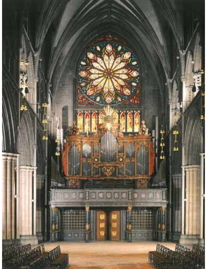
Trondheim, Nidaros Domkirke, situatie 1962.