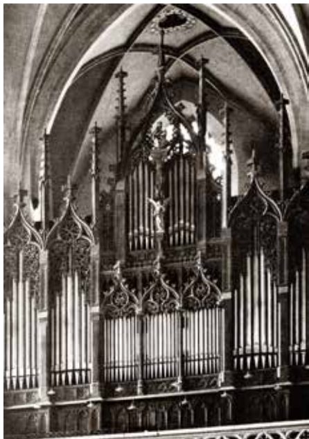
München, Dom zu Unserer Lieben Frau, 1880 (Opus 200).

en Albert Schweitzer. Deze stroming streefde naar de herinstructie van het klassiek gedisponeerde orgel, geschikt voor het uitvoeren van barok-repertoire, maar nog wel gecombineerd met eigentijdse tractuur en ook romantisch-symfonische stemmen. In Nederland is het grote Walcker-orgel in de Martinikerk te Doesburg een gaaf voorbeeld van deze stroming.