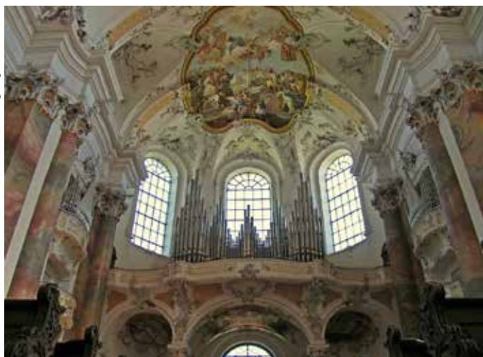
Ottobeuren, Benedictijner Klosterkerk, Marienorgel, 1957 (Opus 1930).