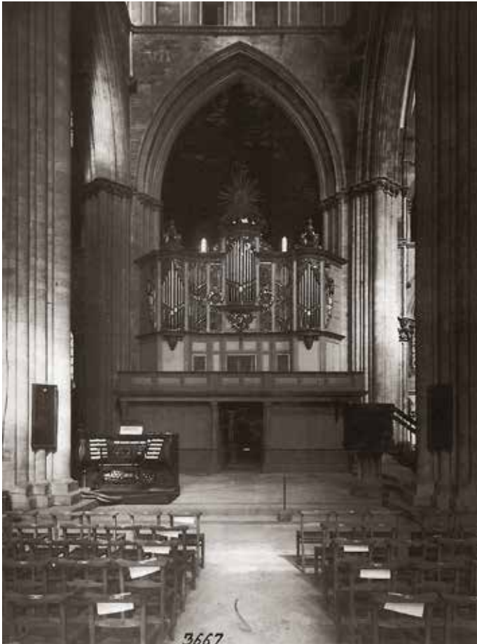
Trondheim, Nidaros Domkirke, 1930 (Opus 1500). Situatie kort na de bouw.