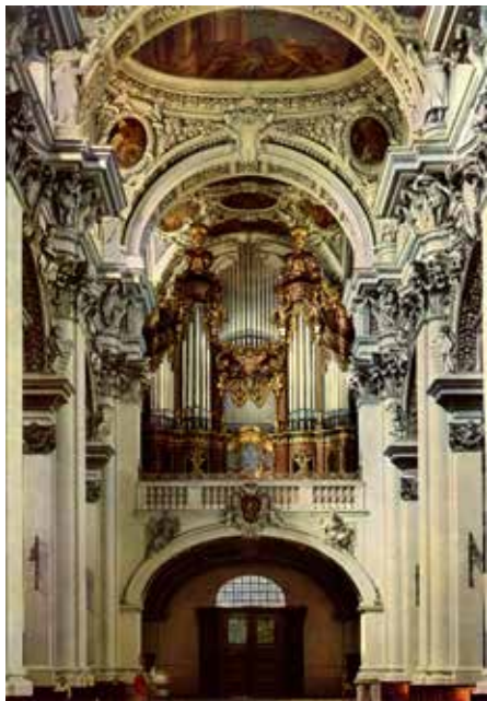
Dom, Passau, 1924/1928 (Opus 1388/1480), situatie jaren '50. (Echte Kohlbauer Farbkarte auf Perutz Color-Film.)