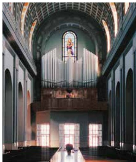
Altoona, Cathedral of the Blessed Sacrament, 1931 (Opus 1543).