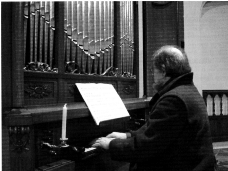
Aan het Freytag-kabinetorgel, sinds begin dit jaar opgesteld in de kooromgang van de Martinikerk.