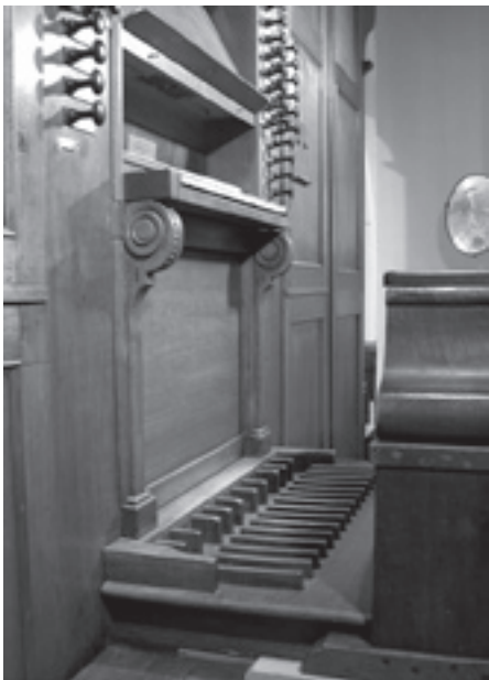
De gerestaureerde klaviatuur met het in ere herstelde kistpedaal.

voor een Fluit Harmoniek 8 vt en een Trombone bas 8 vt en Clarinette disc 8 vt.