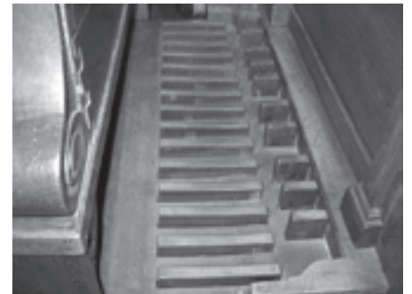
Het typische Van Hirtum-kistpedaal: "de verheven toetsen belegd met rood koper de platte toetsen met Geel koper". In Hilvarenbeek is de pedaalomvang C-c 1 .

In 1990 wordt een brandvrije houten wand met deur geplaatst tussen de toren (eigendom van de gemeente) en de kerk. Hierdoor wordt de zomerse