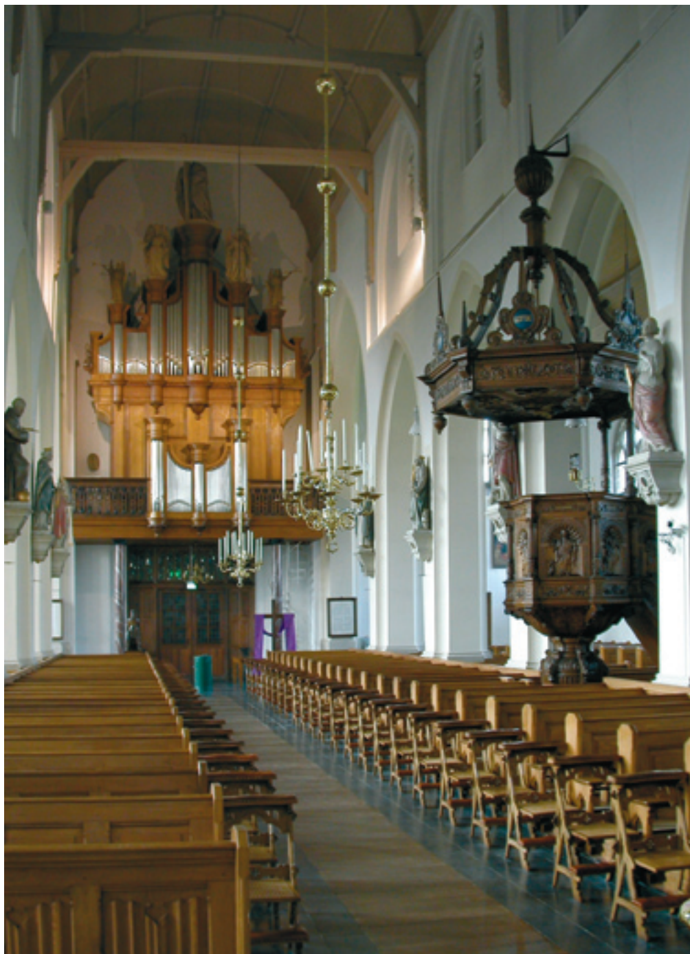
Het Beekse orgel schittert in klank en kleur na de laatste klankrestauratie

De huidige parochiekerk van Hilvarenbeek is, zoals vele kerken in het Brabantse land, ongeveer anderhalve eeuw – van 1648 tot 1800 – in gebruik geweest bij de protestanten. In die periode bezat de