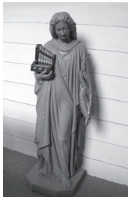
De heilige Caecilia lijkt wat ontheemd in de Beekse kerk te peinen over haar vroegere bijzondere 'onderdaan', waarvan zij slechts een verkleind voorbeeld in haar arm mag koesteren.

via de manuaallade hun wind krijgen. Door wijziging van de balgstoel en het onder een hoek leggen van de balgen, het aansluiten van de motor op beide balgen voorbij de vouwen en verbetering en deels vernieuwing van de windkanalen, is de windvoorziening binnen de bestaande mogelijkheden vooralsnog geoptimaliseerd. Daar de beelden op het positief de doorgaande lijn van de indrukwekkende brede onderlijst van het manuaal verstoren, zijn de beide musicerende engelen geplaatst op de beide uiterste ronde torens van de hoofdwerkkas; Caecilia met orgeltje en zegepalm mag voorlopig achter op de orgelgalerij vertoeven om van daaruit te smachten naar haar grote orgel.