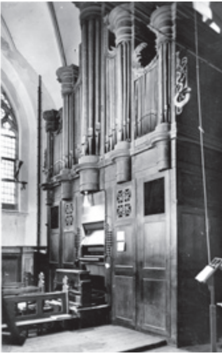
Een verbazingwekkende opstelling: het 1905 tot 'dwarstligger' gedegradeerde orgel op de voor het koor nu 'opgeruimde' galerij.