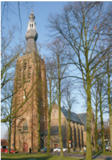
De Petruskerk van Hilvarenbeek met zijn in totaal 70 meter hoge toren behorend tot de Kempische gotiek. Karakteristiek daarbij is de 30 meter hoge eikenhouten torenspits uit 1620 met (van onder naar boven) achtkant, appel, lantaarn en peer.

overgeplaatst naar de Protestantse kerk in Oisterwijk. Dit daar nog in gebruik zijnde orgel dateert uit ca. 1750.