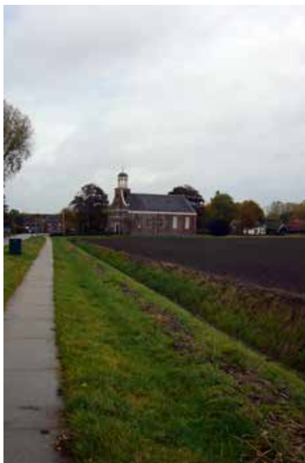
De kerk van Nieuw Beerta aan de rand van het dorp, op een sombere najaarsdag.