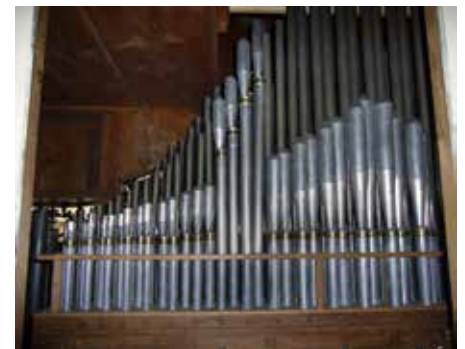
Zicht op het bovenwerk van Kimswerd. Bij de nieuwe Vox Humana moesten ter plekke diverse stevels extra worden verlengd om een bevredigend klankresultaat te krijgen. Tussen (doorslaande) tongen en stevellengtes bestaat namelijk een duidelijk relatie.