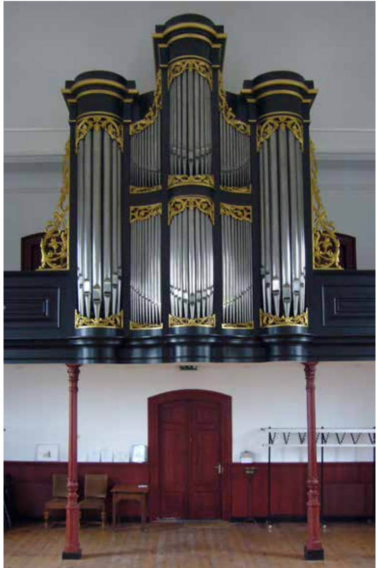
Het Hardorff-orgel (1857) te Nieuw Beerta. Verschillende fronttypes van Hardorff gaan terug op die van Van Dam. Bij dit overgenomen ontwerp – en bij het voorbeeld – zien we dat het front niet helemaal de lading dekt: de bovenste tussenvelden 'houden te vroeg op'.