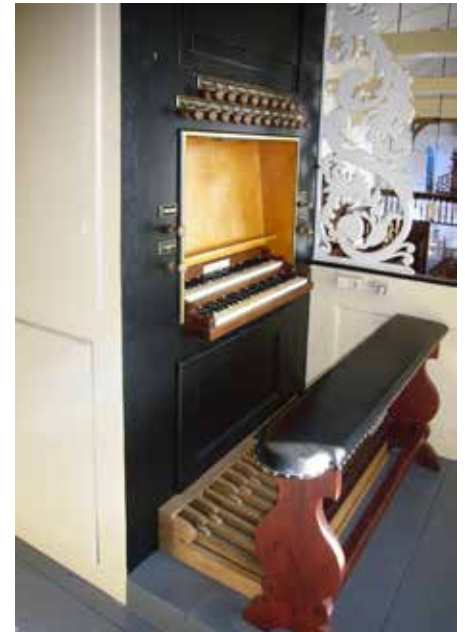
De klavieren van het orgel van Kimswerd, met weer de oude (gerestaureerde) orgelbank en gereconstrueerd pedaalklavier.

werden ingeruild voor een Gamba en een Voix Celeste; in 1918 en 1922 was er herstelwerk aan ondermeer de klavieren. In 1964 werden door Wim Eppinga uit Britswerd bij een niet in stijl passende restauratie deze stemmen vervangen door andere uitersten: een Terts 1 3/5 vt en Quint 1 1/3 vt. Het aangehangen pedaal werd uitgebreid met cis 1 en d 1 , met een nieuw pedaalklavier en orgelbank. Een pneumatische tremulant werd aangesloten op de knop Ventiel. Er kwam een nieuwe windmachine. De orgelkast werd geverfd in ‘Pruisisch blauw’ en de frontpijpen werden gepolijst. In 2012-2013 werd het orgel opnieuw gerestaureerd. Hierbij werden tevens