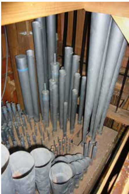
Easterlittens, binnenwerk hoofdwerk, met vooraan de Trompet 8 vt die in de hoogte van linguaal naar labiaal gaat.

Bij de jongste restauratie kwamen alle orgeldelen aan bod en uiteraard werd er een nieuw pedaalklavier gemaakt naar Hardorff. Op 20 juni 2014 werd het orgel officieel weer in gebruik genomen.