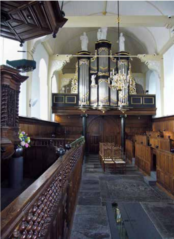
Het Hardorff-orgel (1858) van Kimswerd. Opvallend zijn de beelden – bazuinblazende engelen – tussen de tussenvelden. Op de vloer op de voorgrond een houten luik met glas dat toegang geeft tot een kleine grafkelder.

verhoogd. Het meubilair uit 1695 is “zeldzaam volledig en rijk” (Looyenga). Het orgel dat Hardorff hier opleverde, is waarschijnlijk het eerste instrument in deze kerk. Het front, dat evenals bij Nieuw Beerta, duidelijke Van Dam-trekken heeft, is hier veel luxer. Het beeldwerk tussen de tussenvelden, in nissen staande bazuinblazende engelen, is niet alledaags.