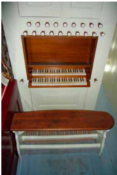
De klavieren van het Hantumer orgel.