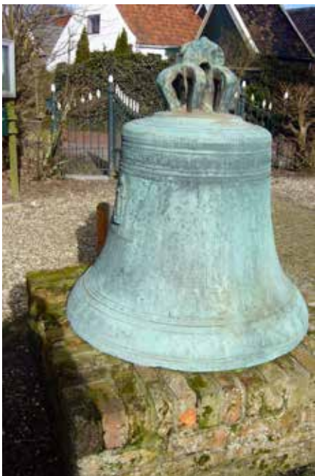
De gescheurde Van Wou-luidklok (1530) naast het kerkhofpad naar de Hantumer kerk. Zijn geboorteplek werd zijn laatste rustplaats.

Bij de bouw van het orgel was ruimte gereserveerd voor een tongwerk; in 1883 kwam er klinkende invulling: een Dulciaan 8 vt, gemaakt door Bakker & Timmenga. Op een onbekend moment werden de frontpijpen aluminium geverfd en werd het toetsbeleg vervangen door celluloid. Bij de jongste restauratie werd het orgel weer teruggebracht naar zijn oorspronkelijkheid. De ingebruikneming was op 27 september 2013. Het instrument klinkt zeer 'ruimte-