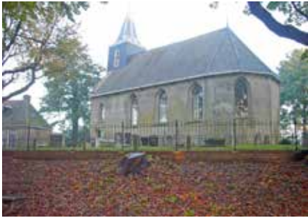
De kerk van Húns in de ochtendmist.

van het vlakke plafond het orgel niet meer terug.