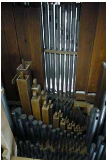
Hantum, discant van de Bourdon 16 vt die geheel van hout is.

Bij de in november 2016 afgesloten werkzaamheden – een deel van het werk was reeds in 2014 uitgevoerd – werden onder meer de laden geres-taureerd, waarbij de pulpeten werden vernieuwd en geweven ringen werden aangebracht op de sleepbanen en onder de stokken. Het messing draadwerk bij de speelmechaniek werd vervangen. De orgelkast werd –