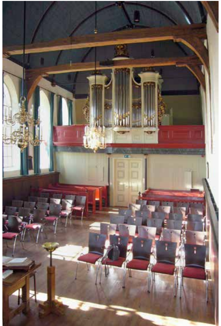
Het Hardorff-orgel (1876) te Hantum. Rechts op de galerij een deel van het balghuis. De klaviatuur bevindt zich eveneens rechts, met daar anderhalve meter naast de plaats waar van 1876 tot 1964 de orgeltrapper aan het treden was. Je zou als organist vlak voor kerktijd maar ruzie met hem hebben gekregen ...

Bij de bouw had Hardorff gebruikgemaakt van ouder materiaal, wat te herkennen valt aan de inliggende voorslagen – ongebruikelijk voor