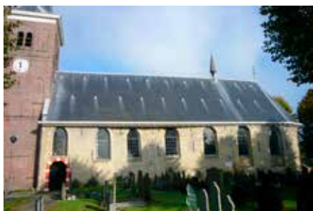
De kerk van Easterlittens vanuit het zuiden, met de dakruiter.

De destijds aan St.-Margaretha gewijde kerk, twaalfde-eeuws en in tufsteen, werd een eeuw later uitgebreid met een rondgesloten koor. In 1854 werd de toren ommetseld en het zadeldak vervangen door een ingesnoerde helmspits. Niet alledaags is dat op het kerkdak een kleine dakruiter staat met een (angelus)klokje. Aan de noordkant staat een sacristie die in de negentiende eeuw een ander aanzien kreeg. In dit bijgebouw bevindt