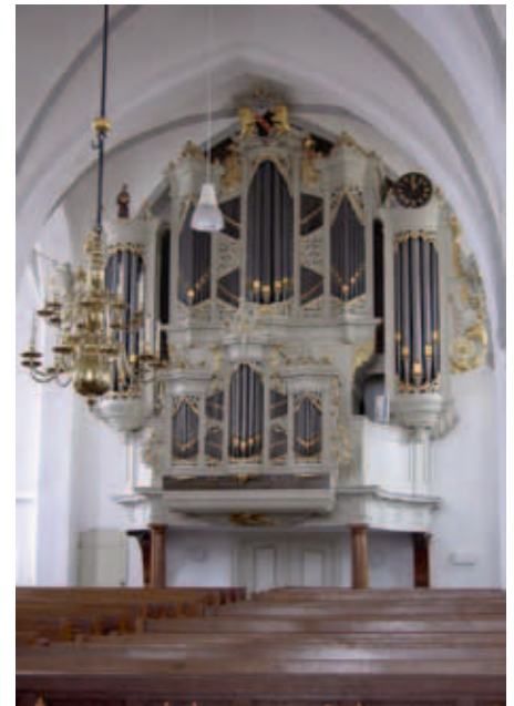
Het Paradijs-/Leeflang-orgel in de Oude Kerk van Barneveld.