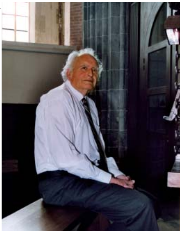
Aan het koororgel van de Martinikerk in Groningen.