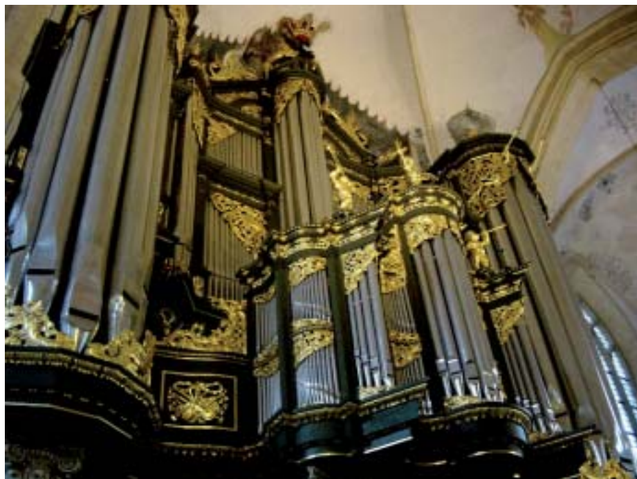
Het orgel in de Groninger Martinikerk.

“Ik was in die tijd organist van de Gereformeerde kerk in Woerden; ik heb op dat orgel heel veel gestudeerd. Het was dan wel pneumatisch, maar ik kon er goed mee overweg. Ik herinner me nog heel goed dat ik heel vaak op de fiets naar Bodegraven ging om Feike Asma te horen. Ik was toen echt een fan van Feike Asma. Veel organisten van mijn generatie zijn eigenlijk zo begonnen door naar Asma te gaan. Ik vond hem prachtig spelen, en heel muzikaal. Ik heb daar leuke herinneringen aan. Maar als je dan zelf aan een conservatoriumstudie begint en je krijgt wat meer informatie, dan ga je er toch wat kritischer tegenover staan.