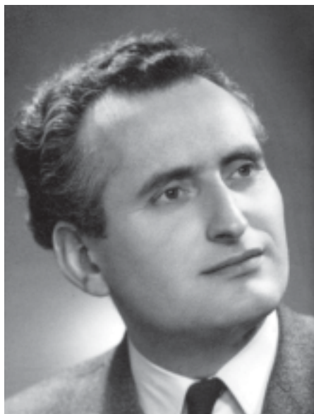
Portret uit de jaren vijftig.