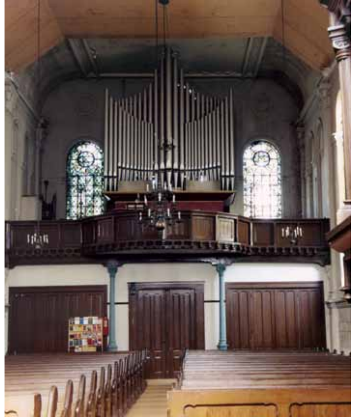
De voormalige Duits-Evangelische Kerk met het Steinmeyer-orgel.