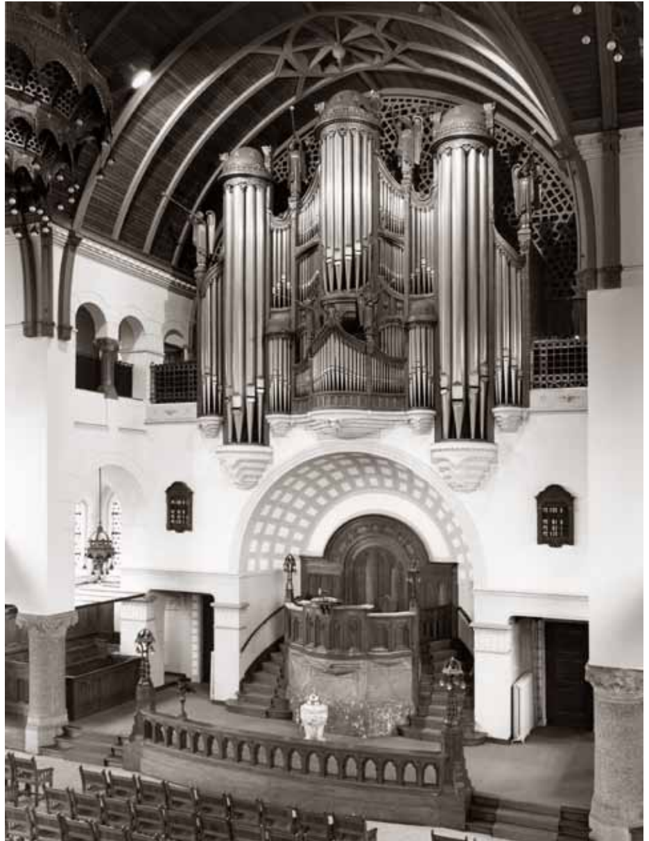
Het Walcker-orgel in de voormalige Nieuwe Zuiderkerk te Rotterdam.

In diezelfde periode werd nog een aantal grammofoonplaatopnamen van