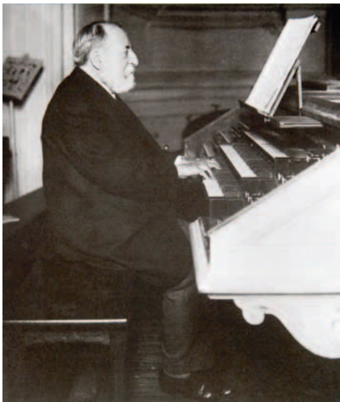
Saint-Saëns bespeelt het orgel in de Salle Gaveau, 6 november 1913.

weer op. Vanaf 1896 maakte hij weer orgeltournees, onder meer gaf hij een groot aantal concerten in Nederland. Tussen 1894 en 1898 schreef Saint-Saëns een nieuwe reeks orgelwerken: de Trois Préludes et Fugues opus 99 (1894), de Fantaisie opus 101 (1895), de Marche religieuse opus 107 (1897?) en de Trois Préludes et fugues opus 109 (1898). De Trois Préludes et Fugues opus 99 zijn de eerste orgelwerken na bijna dertig jaar, ze werden respectievelijk opgedragen aan Widor, Guilmant en Gigout en zouden naar het oordeel van Vierne verplichte kost moeten zijn voor elke serieuze organist. De eerste twee stukken zijn gracieus en smaakvol en behoren tot zijn beste composities voor het instrument, het derde stuk daarentegen is in muzikaal opzicht wat minder aantrekkelijk. De Fantaisie opus 101 is een van de meest romantische werken van Saint-Saëns. De pompeuze Marche religieuse voerde Saint-Saëns uit in een privéconcert voor de Spaanse koningin Maria Christina in de San Francisco-kerk in Madrid; ook speelde hij het