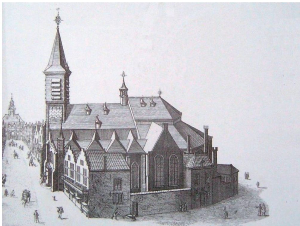
De vroegere Vroewekerk te Leiden, destijds de thuisbasis van de Waalse gemeente.