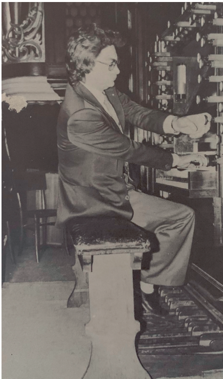
Aan het Dordtse Kam-orgel, begin jaren '80.