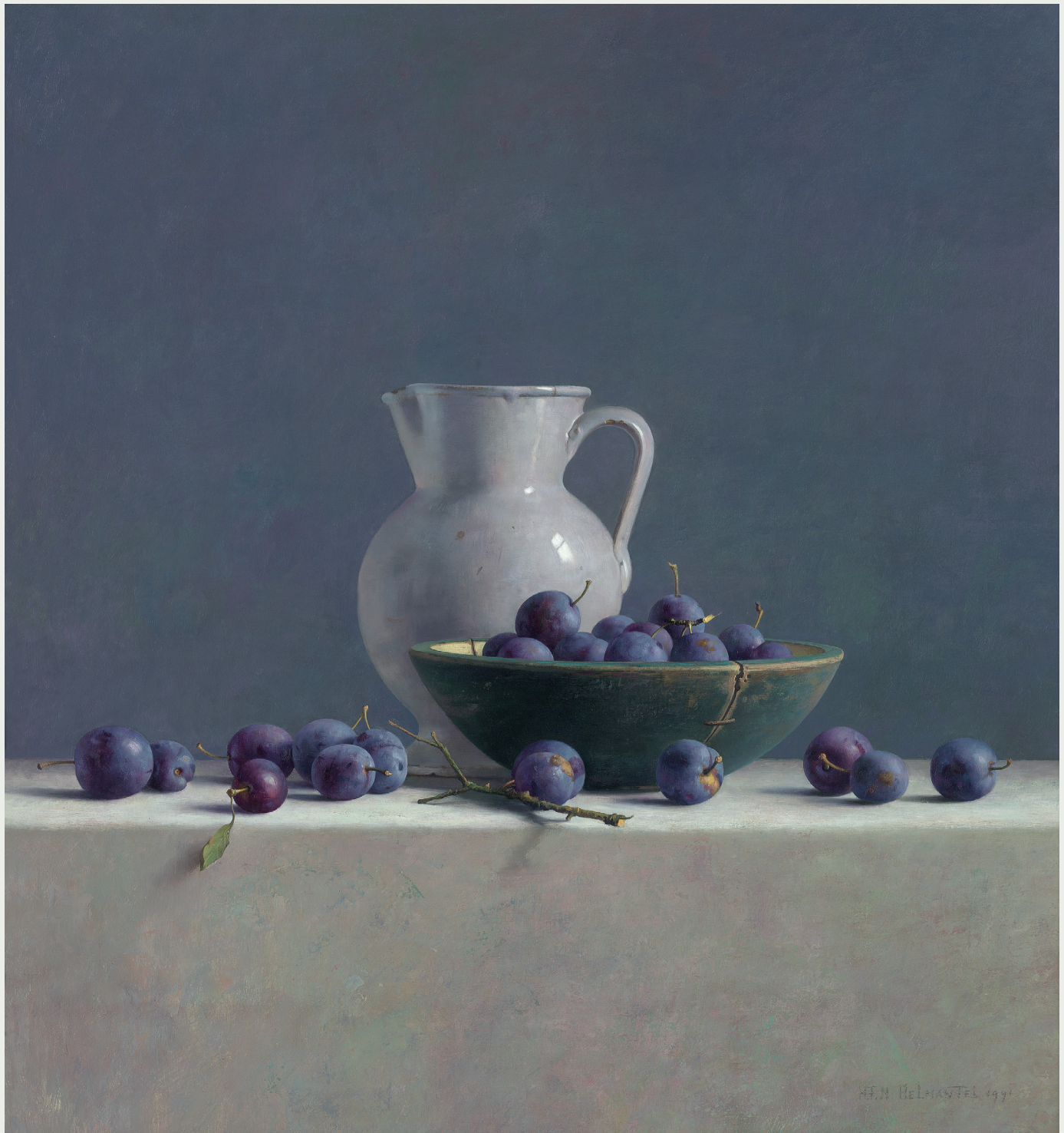
STILLEVEN MET PRUIMEN EN SPAANSE KAN, 1991