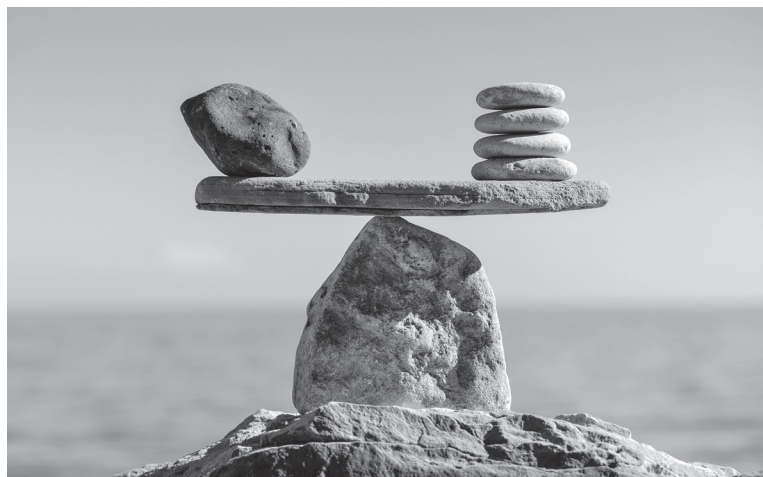
Beeld van gelijkwaardigheid: elk steentje is even belangrijk voor de balans

Hier leert Jezus ons iets heel belangrijks over leiderschap. Als Hij ons vrienden noemt, wie zijn wij dan om elkaar tot slaaf te maken? Tot mensen die gewoon doen wat je zegt zonder te vragen waarom? Als Jezus ons bekendmaakt wat de Vader Hem bekendmaakt, zouden wij dan ook niet in diezelfde lijn openhartige en wederkerige relaties moeten hebben? Degene die alle macht heeft, leert nu juist om niet over elkaar te gaan heersen (Mat. 23:10-11, 28:18).